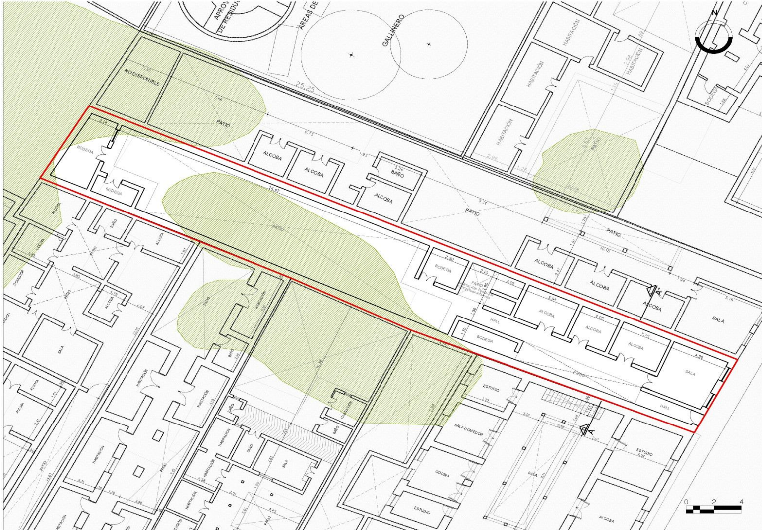
Planta primer piso